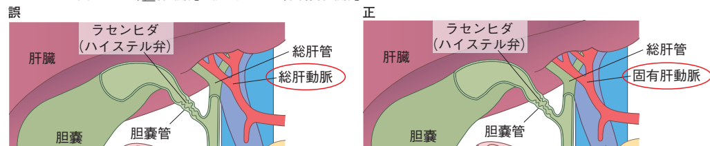
95 ページ 図 11-8 「総肝動脈」は誤り、正しくは「固有肝動脈」